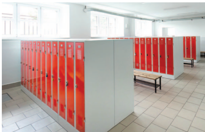
Šatny ZŠ T. G. M.

Čerpací stanice 7 Station v Hrádku nad Nisou hledá pracovníka na pozici obsluhy čerpací stanice a směnární.