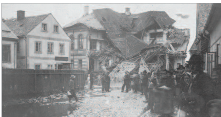
Velká voda v roce 1897 poničila objekt dnešní restaurace Dělnický dům