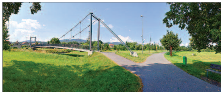
Stará lávka U Koruny ráno 9. srpna 2010, kdy nad Hrádkem vysvitlo slunce. Nová lávka se slavnostně otevírala 21. května 2012 a dodnes je díky vydařenému návrhu architektonickou zajímavostí města.