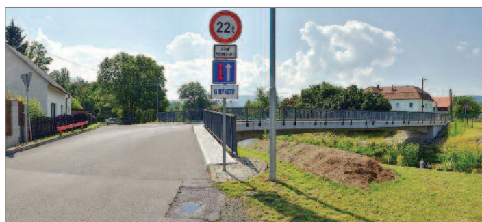
Zcela zničen byl most U Nývlů. Nový se otevíral 21. prosince 2011 jako první z dokončených mostních staveb po povodni.