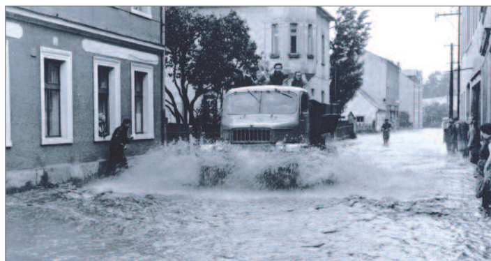
Voda v Tovární ulici v roce 1958