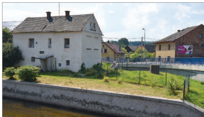
Na deset domů musel být po bleskové povodni vydán demoliční výměr. Dům č. p. 1 u donínského mostu byl bourán už 19. srpna.