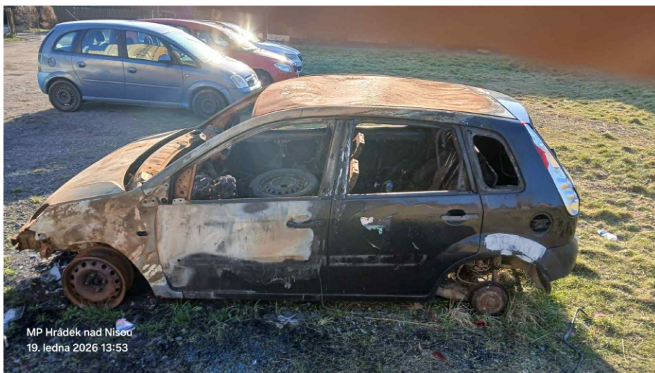
MP Hrádek nad Nisou 19. ledna 2026 13:53