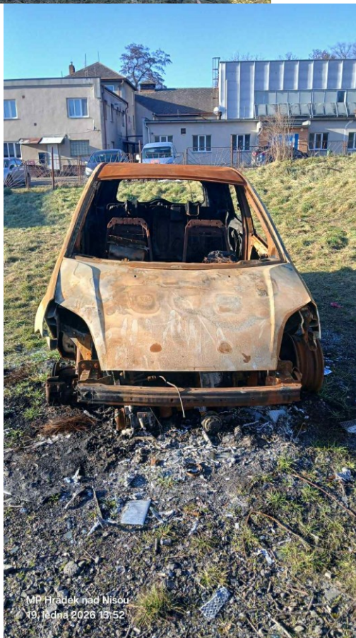
MP Hrádek nad Nisou 19. ledna 2026 13:52

Za správnost vyhotovení: Simona Kubičínová