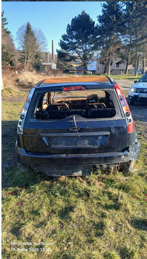
MP Hrádek nad Nisou 19. ledna 2026 13:52