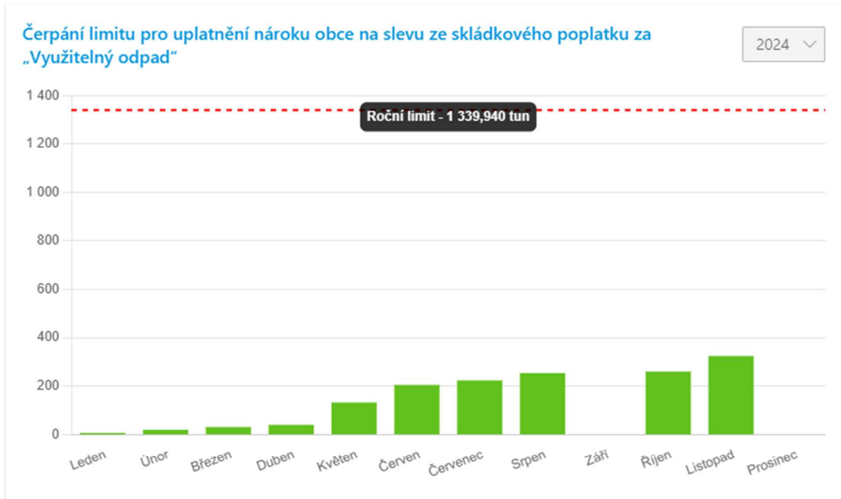
Graf č. 4 a tabulka č. 4